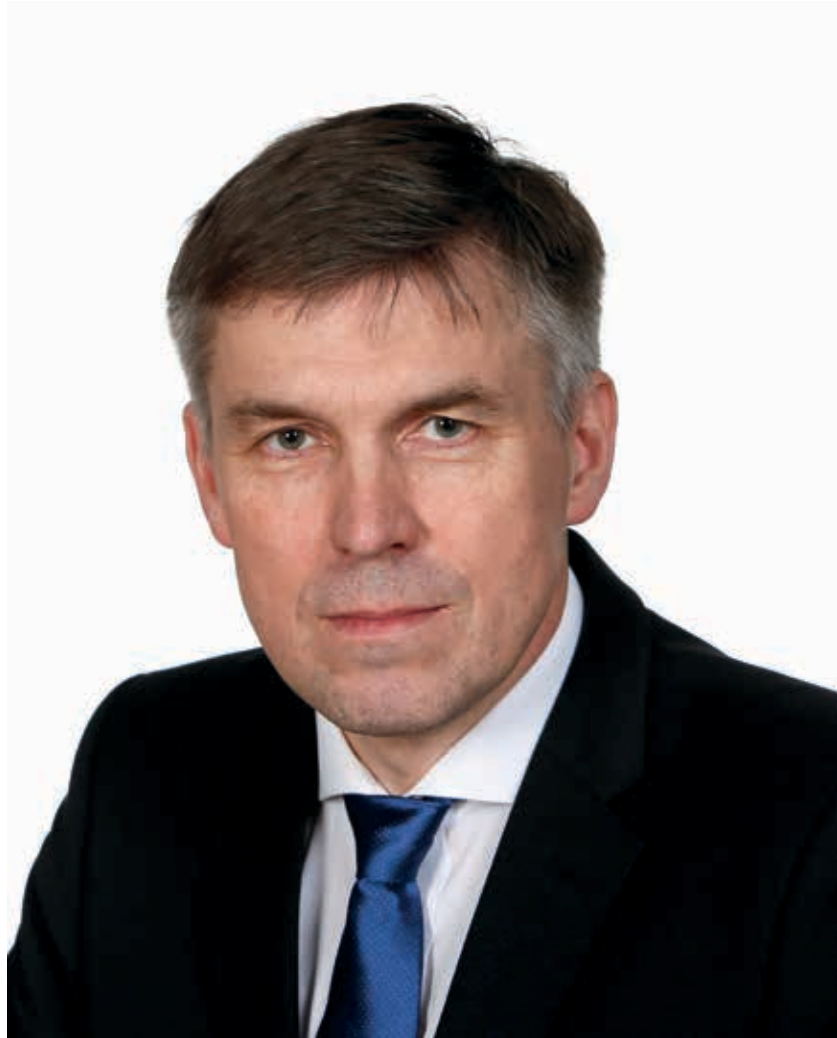
Kuva: Jaana Kankaanpää